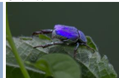
Hoplie ( pacage )