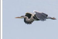
Héron cendré ( Varennes )