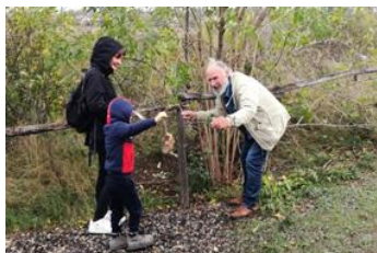
Tournesol pour les oiseaux