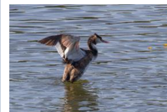
Grèbe huppé ( Pacage )