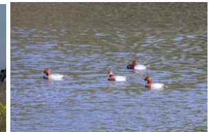
Fuligules milouins ( pacage )