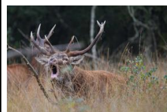
Brame du cerf

Alain a présenté quelques unes de ses dernières photos