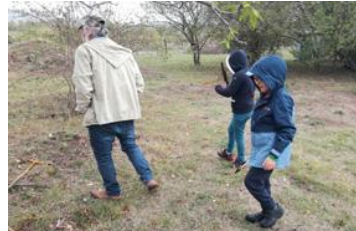
Recherche de plumes