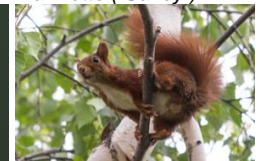
Ecoreuil ( Lempdes )