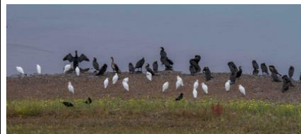
Garde boeufs et cormorans ( Varennes )