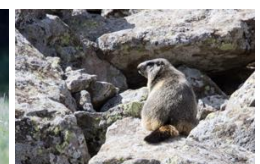
Marmotte ( Sancy )