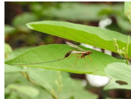
Rhyse, guêpe de 8cm (pacage)

Daniel Zorn a présenté des vidéos rares de nourrissage de jeunes de huppe fasciée et de 3 couples de pics verts