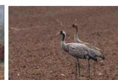
Adulte et jeune