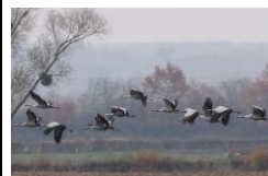
Grues cendrées