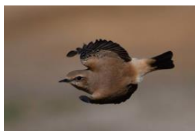
Traquet du désert