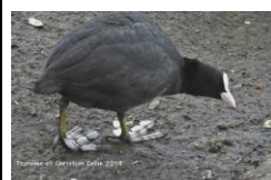
Foulque (pattes lobées)