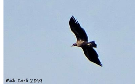
Mick Carli 2019