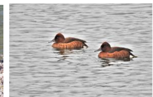
Fuligule nyroca (F&C Collin)