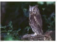
Hibou petit duc scops