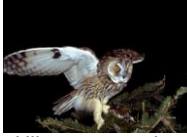
Hibou moyen duc