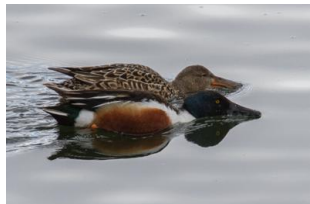
Canard souchet

Alain a présenté des photos récentes prises à l'écopole, avec en particulier les bihoreaux et le garde bœuf à Montagne, le râle d'eau, le héron pourpré, les sternes et les mouettes à Bellerive, les canards souchets au pacage