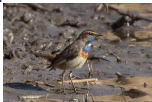
Gorge bleue à miroir

Plus quelques autres photos rares : la marouette ponctuée et la gorge bleue de Fosseville à Gerzat, et le balbusard en vol avec un énorme poisson dans les serres à Pulverrières.