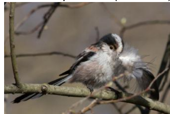
Mésange à longue queue