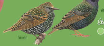
Étourneau sansonnet hiver ● ● ● ● 21 cm