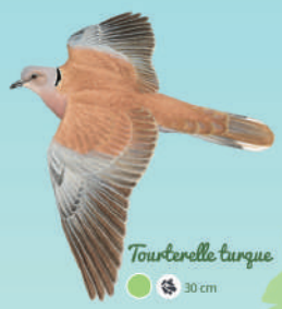
Tourterelle turque ● ● ● 30 cm