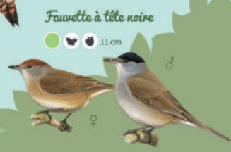
Fauvette à tête noire ● ● ● ● 11 cm