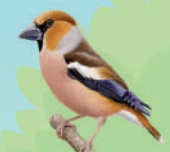
Grèbe casse-noyau ● ● ● ● 18 cm