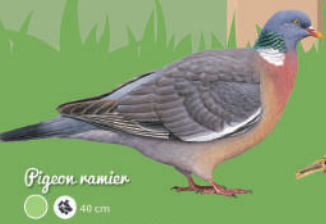
Pigeon ramier hiver ● ● ● 40 cm