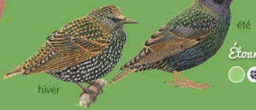
Étourneau sansonnet hiver ● ● ● ● 21 cm