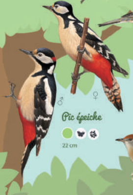
Pic épeiche ● ● ● ● 22 cm