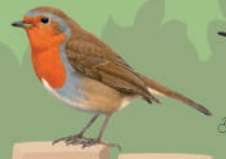
Rougegorge familier ● ● ● ● 14 cm