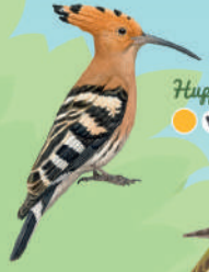
Huppe fasciée ● ● ● 27 cm