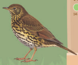
Grive musicienne ● ● ● ● 23 cm