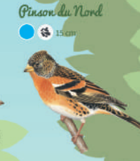
Pinson du Nord ● ● ● 15 cm