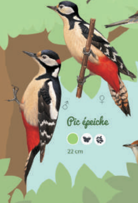
Pic épeiche ● ● ● ● 22 cm