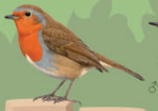
Rougegorge familier ● ● ● ● 14 cm