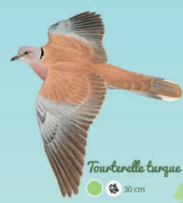
Tourterelle turque ● ● ● 30 cm