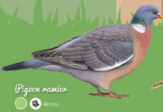
Pigeon ramier hiver ● ● ● 40 cm