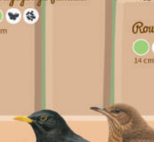
Merle noir ● ● ● ● 25 cm