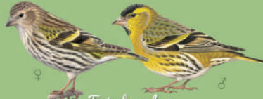
Tarin des aulnes