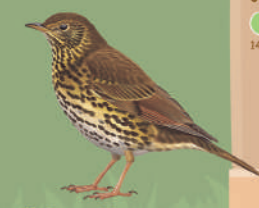
Grive musicienne ● ● ● ● 23 cm