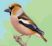
Grèbe casse-noyau ● ● ● ● 18 cm