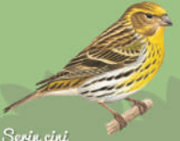
Serin cini ● ● ● ● 12 cm