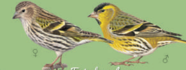
Tarin des aulnes