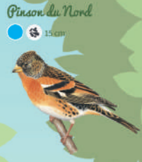
Pinson du Nord ● ● ● 15 cm