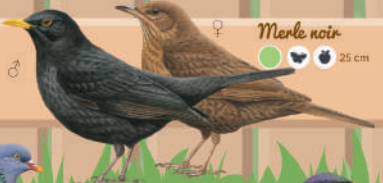
Merle noir ● ● ● ● 25 cm