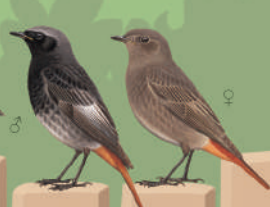
Merle noir ● ● ● ● 25 cm