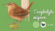
Trogodyte nignon ● ● ● 9 cm