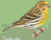
Serin cini ● ● ● ● 12 cm