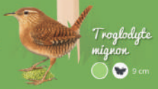
Trogodyte nignon ● ● ● 9 cm